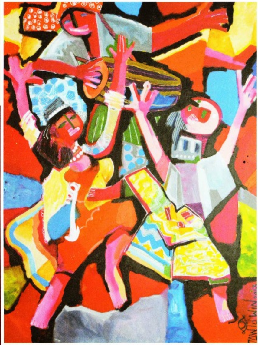
Wild Dance 3 x 4 ft Acrylic on canvas