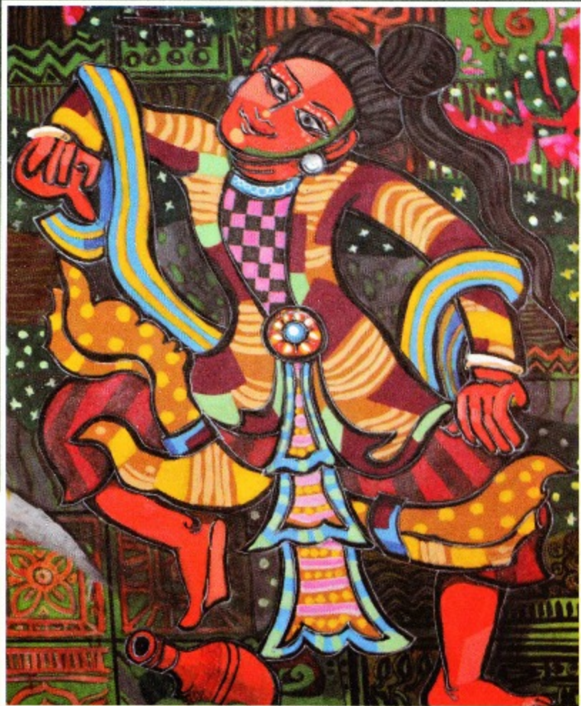
Male Dancer 3 x 4 ft Acrylic on canvas