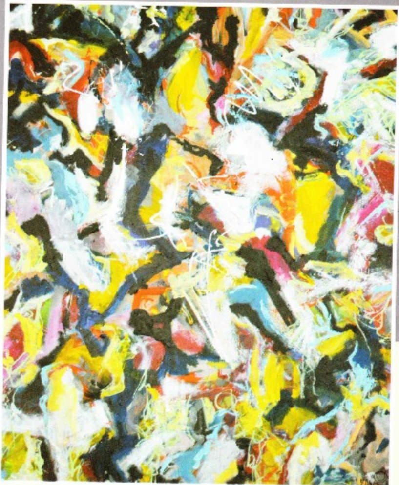
Anger of Continents 3 x 4 ft Acrylic on canvas