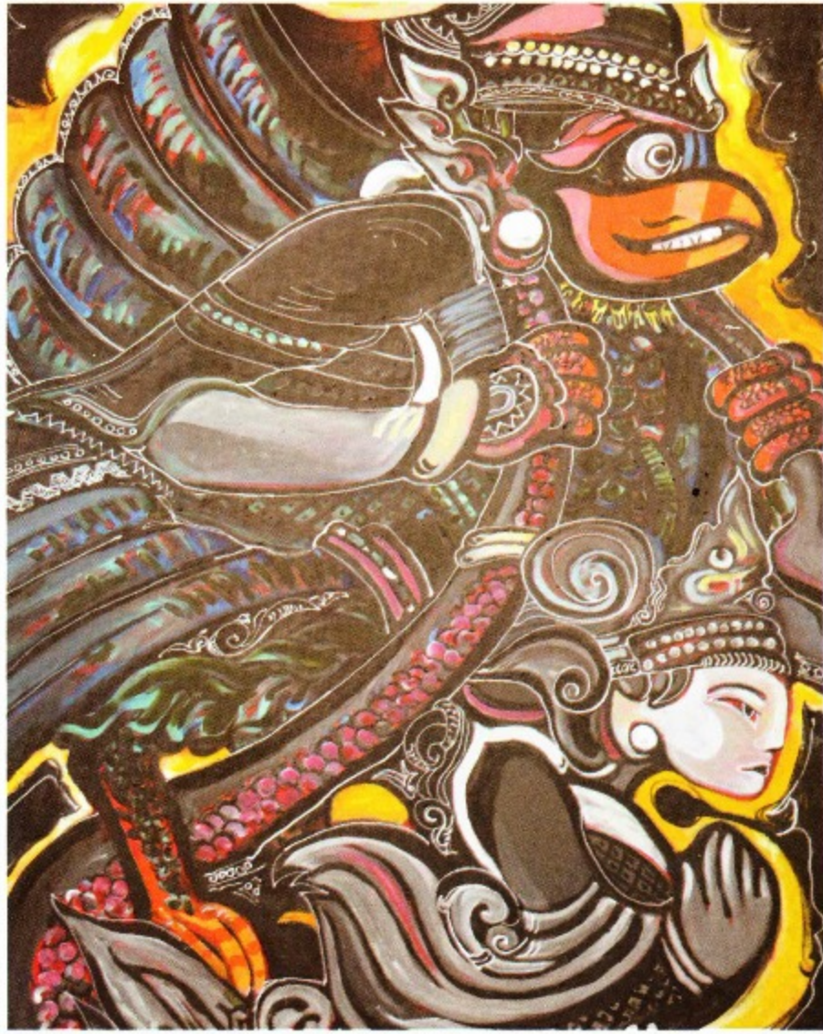
Garuda and Dragon