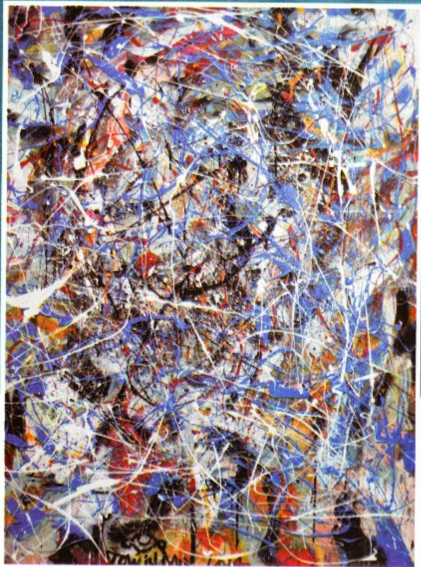
Mindscape No.1 3 x 4 ft Acrylic on canvas