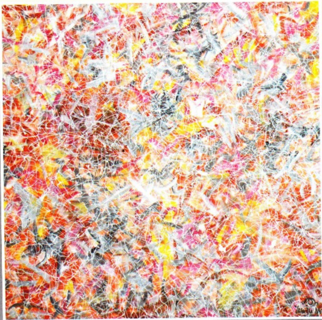
Mindscape 2 24 x 24 ft Acrylic on canvas