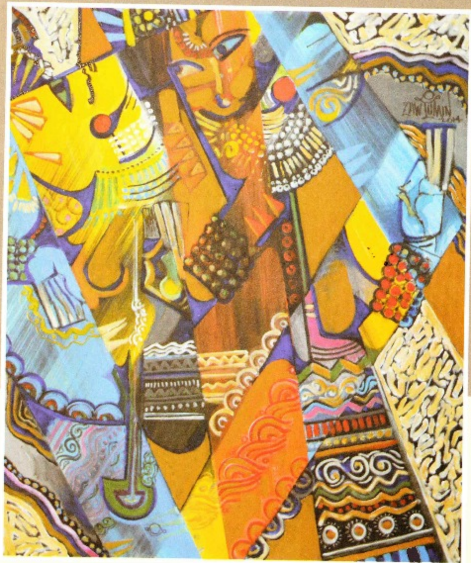
Juxtaposition 30 x 36 ft Acrylic on canvas