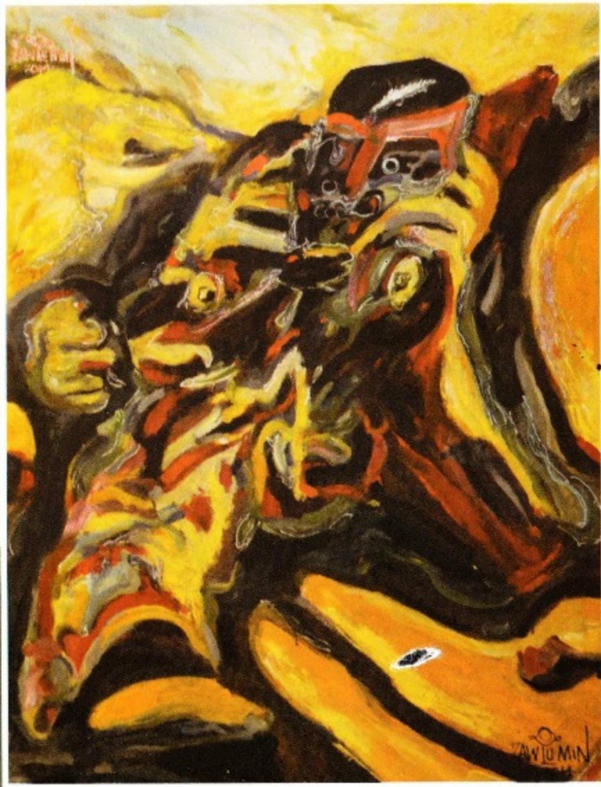
River man 3 x 4 ft Acrylic on canvas